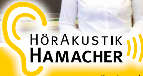
ALEXANDER HAMACHER Hörakustikermeister Päd-Akustiker

3x in Mönchengladbach: Konstantinplatz 13 · MG-Giesenkirchen Kreuzherrenstraße 5 · MG-Wickrath | Glockenstraße 4-6 · MG-Hardt