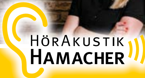
ALEXANDER HAMACHER Hörakustikermeister Päd-Akustiker

2x in Mönchengladbach: Kreuzherrenstraße 5 · MG-Wickrath Konstantinplatz 13 · MG-Giesenkirchen www.hoerakustik-hamacher.de